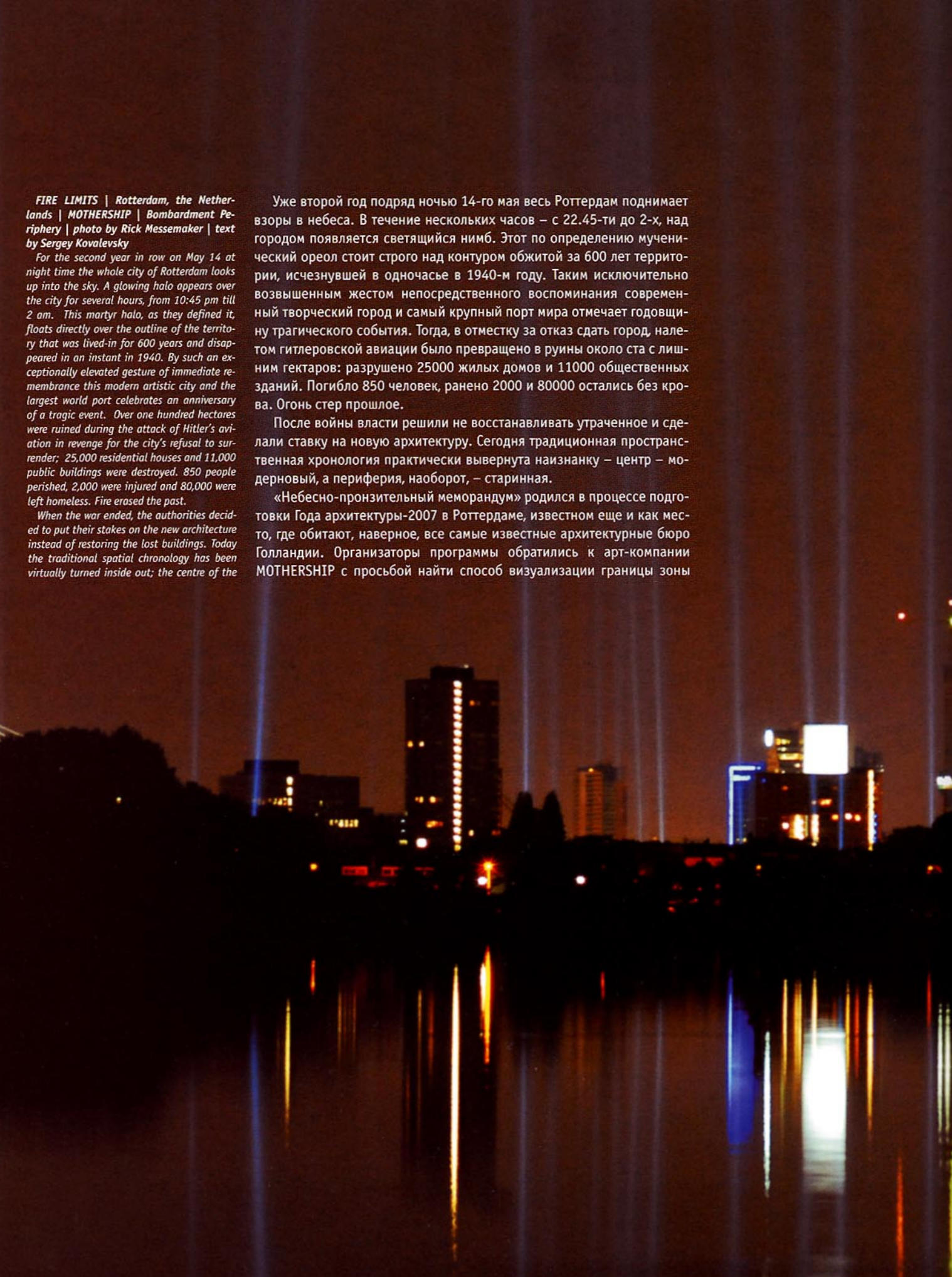
текст Сергей Ковалевский

FIRE LIMITS | Rotterdam, the Netherlands | MOTHERSHIP | Bombardment Periphery | text by Sergey Kovalevsky For the second year in row on May 14 at night time the whole city of Rotterdam looks up into the sky. A glowing halo appears over the city for several hours from 10:45 pm till 2 am. This martyr halo, as they defined it, floats directly over the outline of the territory that was lived-in for 600 years and disappeared in an instant in 1940. By such an exceptionally elevated gesture of immediate remembrance this modern artistic city and the largest world port celebrates an anniversary of a tragic event. Over one hundred hectares were ruined during the attack of Hitler's aviation in revenge for the city's refusal to surrender; 25,000 residential houses and 11,000 public buildings were destroyed. 850 people perished, 2,000 were injured and 80,000 were left homeless. Fire erased the past. When the war ended, the authorities decided to put their stakes on the new architecture instead of restoring the lost buildings. Today the traditional spatial chronology has been virtually turned inside out; the centre of the